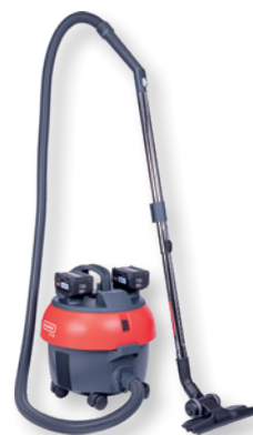
S10 Plus CAS