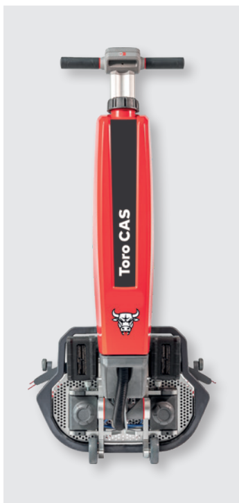
Cleanfix Toro CAS in Transportposition