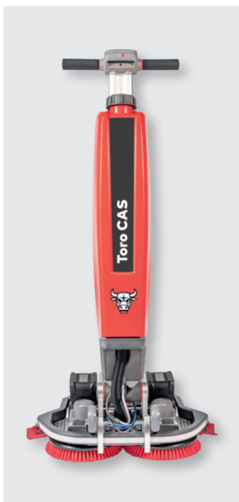
Cleanfix Toro CAS in Arbeitsposition