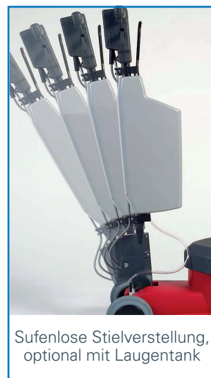
Sufenlose Stielverstellung, optional mit Laugentank