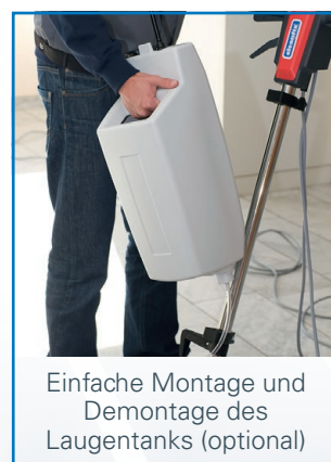
Einfache Montage und Demontage des Laugentanks (optional)