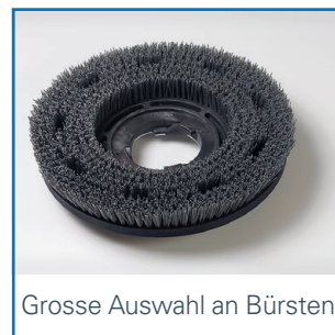
Grosse Auswahl an Bürsten