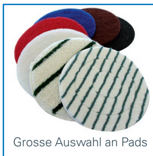
Grosse Auswahl an Pads