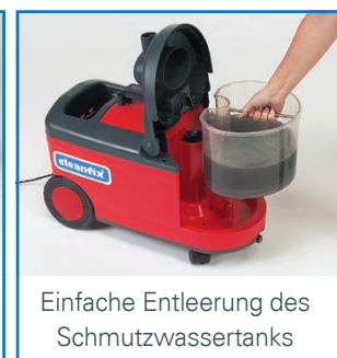
Einfache Entleerung des Schmutzwassertanks