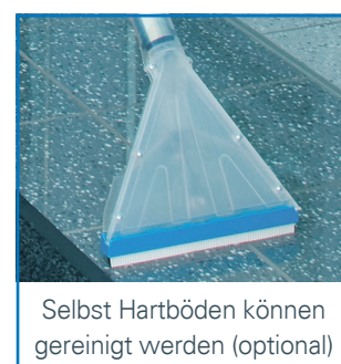
Selbst Hartböden können gereinigt werden (optional)