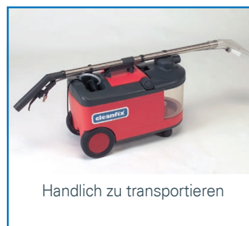
Handlich zu transportieren