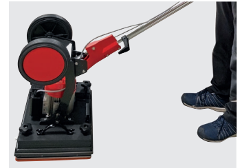
Deichsel auf Kopf stellen für maximales Arbeitsgewicht