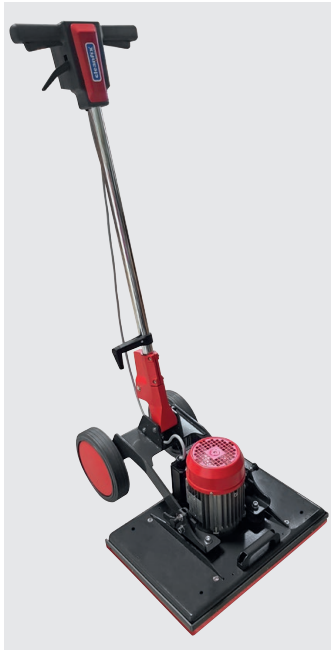
E50x35 Excenter Lieferumfang

Durch die viereckige Konstruktion kommen Sie perfekt in jede Ecke. Unsere patentierte Stielverstellung sowie die grossen Räder für den einfachen Transport sind bedeutende Vorteile. Von Nutzen sind auch die zwei Rasten (750.586 Kit Rastbolzen) auf dem Gehäuse, mit denen Sie entweder die Räder vom Boden abheben um keine Laufspuren zu hinterlassen oder die Deichsel komplett auf den Kopf stellen können um ein maximales Gewicht auf den Boden zu bekommen. Durch gestückelte Zusatzgewichte können Sie das Maschinengewicht perfekt Ihrer Anwendung adaptieren. Stellen Sie den Bürstkopf von der E50x35 Excenter einfach auf und Sie können die Pads bequem wechseln oder die Maschine optimal lagern.