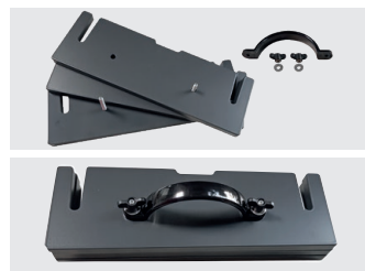
Gewichte einfach adaptierbar (Sonderzubehör)