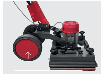
Räder vom Boden abheben um keine Laufspuren zu hinter- lassen