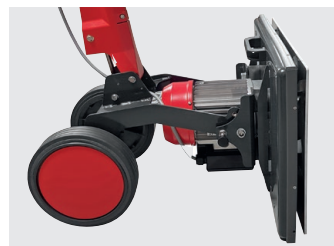
Bürstkopf aufgestellt für die optimale Lagerung